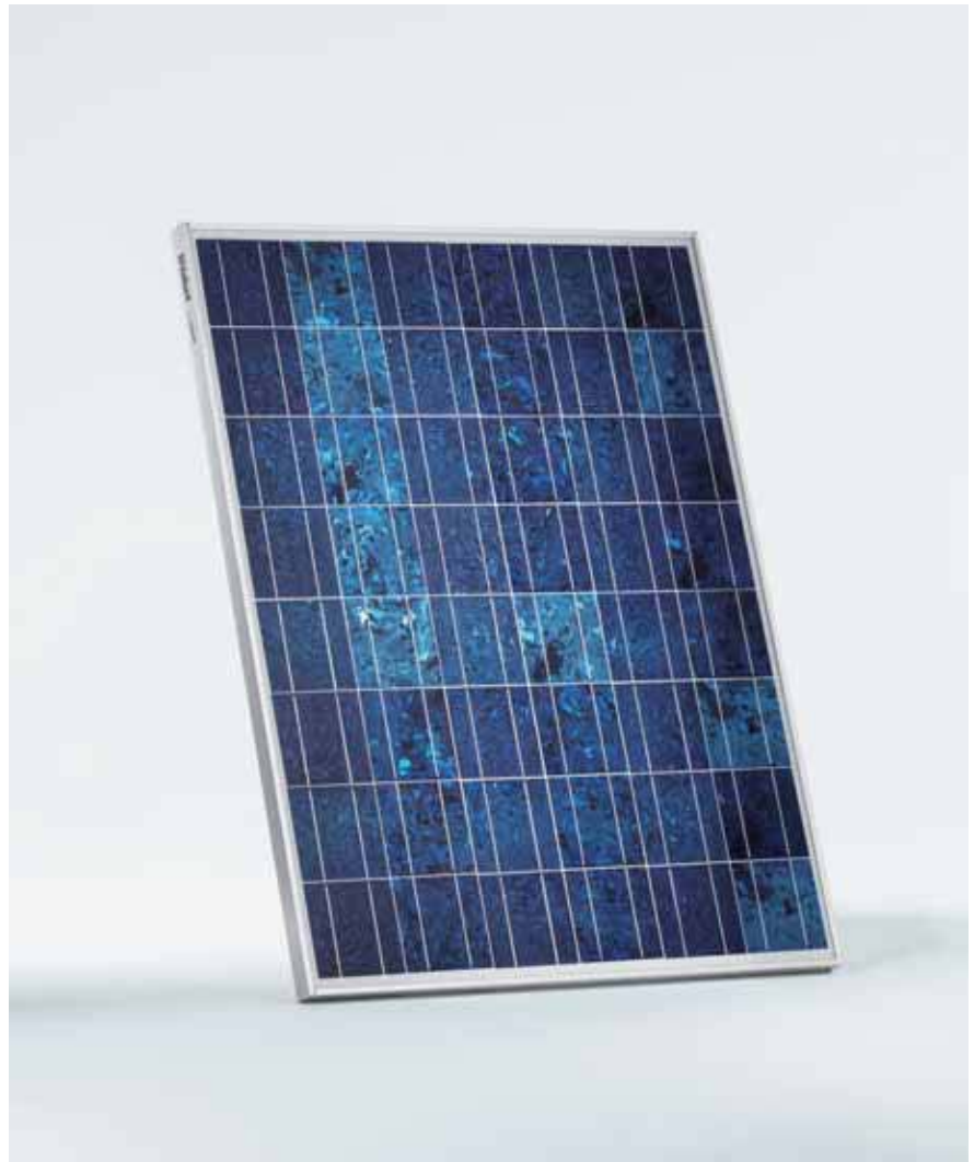
auroPOWER-VPM P 162

Das auroPOWER-VPM P 162 eignet sich für den Einsatz in Inseln oder in netzgekoppelten Systemen. Durch die Auslegung auf bis zu 1.000 V Systemspannung ist das Modul für Einzelanlagen ebenso geeignet wie für Großanlagen. 25 Jahre Garantie auf 80 % der Minimalleistung stehen für klar kalkulierbare Erträge und bieten damit hohe Planungssicherheit.